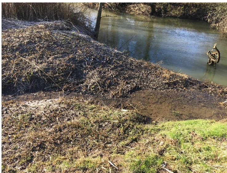
Sédimentation (vue vers la connexion) le 13 février 2019 débit : 0,8 m 3 /s

Le CENL a procédé à des mesures de sédimentation en 2017. Il a été constaté une sédimentation de 50 cm en un an. Cette année, aucune mesure topographique n'a été réalisée, mais visuellement, il a été observé un atterrissement de sable à la connexion.