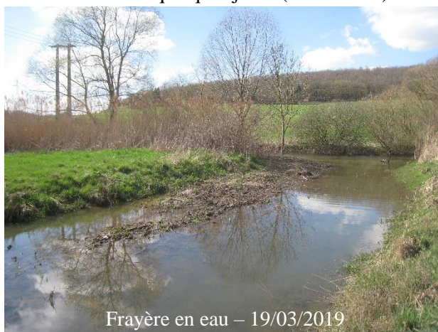
Frayère en eau – 19/03/2019

Cette année, la frayère a été en eau seulement quelques jours (semaine 11) entre février à mai.