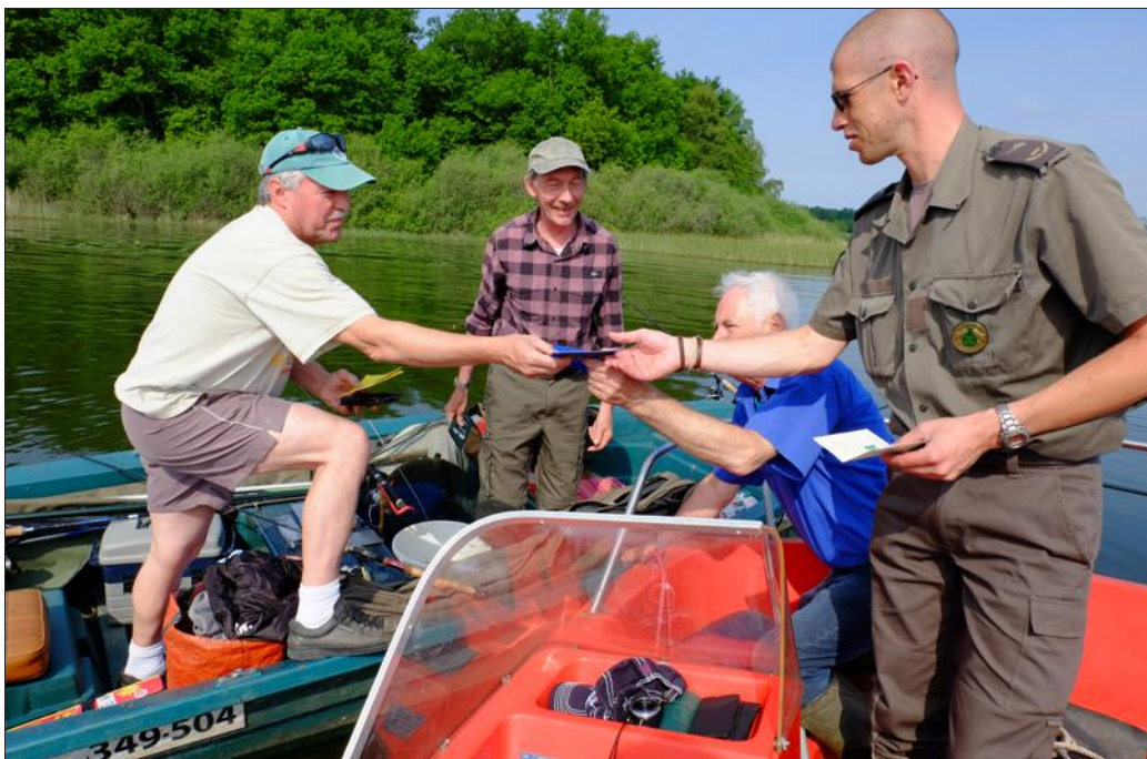
En cette journée d'ouverture, tous les étangs réservoirs ont été contrôlés par les équipes de l'AAPPMA. La gendarmerie fluviale de Metz a aussi fait des passages matinaux.